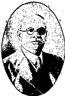
आनरेबल डा. सर मनोहरलाल, लाहौर